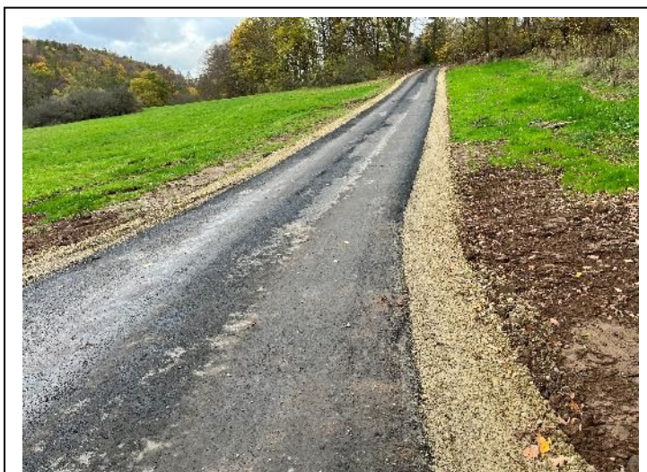
Neuer Weg im Oechsetal

Weiterhin schließt das Projekt auch das Handlungsfeld „Energie, Klima und Ressourcenschutz“ mit dem Unterziel „Stärkung von Aktionen zum Klimaschutz und der Anpassung an den Klimawandel“ ein. Der klimafreundliche Radverkehr wird durch diesen Alltagsradweg in unserer Region erheblich gestärkt und bietet mehr Menschen die Möglichkeit für ihre täglichen Weg vom Auto auf das Fahrrad umzusteigen.